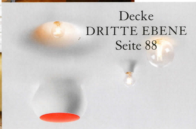
Decke DRITTE EBENE Seite 88