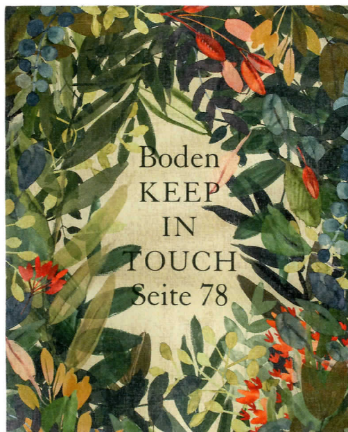
Boden KEEP IN TOUCH Seite 78