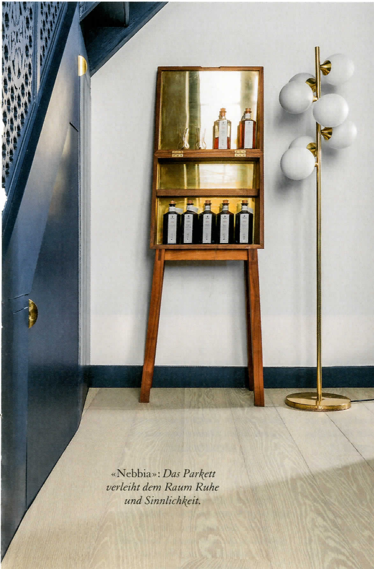
«Nebbia»: Das Parkett verleiht dem Raum Ruhe und Sinnlichkeit.

«Terra»: Die Farbnuance ist warm und erdig und verleiht dem Raum Lebendigkeit.