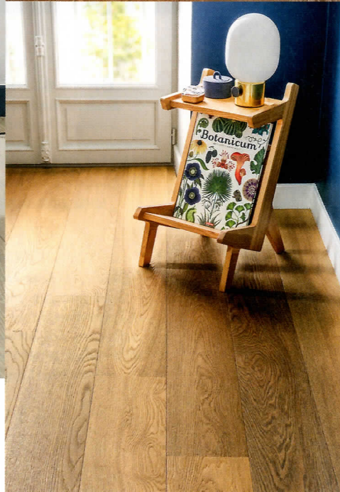
«Canneto»: Der Parkettboden erinnert mit seinem dezent gedeckten Farbspiel an Schilfblätter am Seeufer.